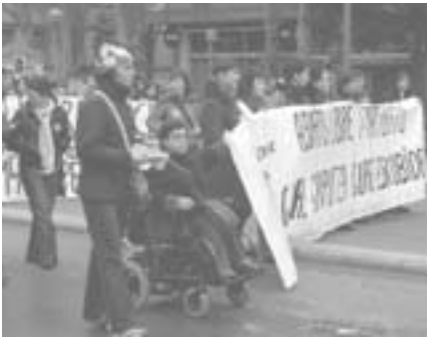
Cabeza de la manifestación el 8 de marzo en Gasteiz.

Un año más las mujeres con discapacidad física alavesas, representadas por Eginaren Eginez, han desfilado por las calles gasteiztarras, junto con los colectivos feministas y sindicatos, denunciando la situación de discriminación de TODAS las mujeres y la múltiple discriminación que confluye en varias de nosotras en razón de la discapacidad, la etnia, el origen, la opción política, etc.