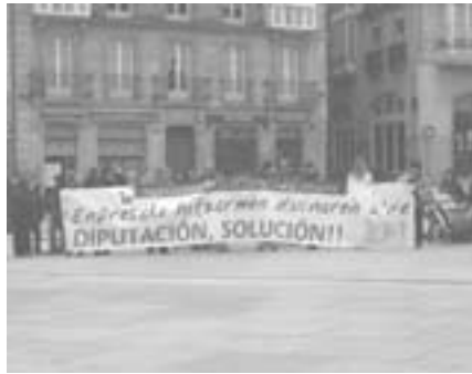
Algunas de las protestas laborales, al término de la manifestación, ya que el mayor número de afectadas son mujeres.

Una vez más se ha hecho referencia a la situación que se vive con el aborto ante el proyecto de la Ley de plazos y se ha hecho referencia también a la repercusión de la situación de crisis en las MUJERES pudiéndose comprobar la lucha que están llevando a cabo trabajadoras de Ayuda a Domicilio y de la Residencia Ariznavarra entre otras.