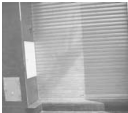
RESTAURANTE EL KOSSO, en Los Herrán 2. El restaurante cuando estaba en obras con los dos escalones que han dejado.