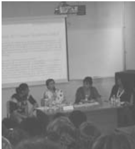
Imagen de una mesa redonda sobre Trabajo Social en Salud.

El gusto en la profesión debe pasar por construir un “buen gusto ético”, basado en principios éticos universales básicos tales como respeto a las decisiones de l@s usuari@s, confidencialidad, o la búsqueda del bienestar. Además hay que aplicar los “nuevos sabores” de la pormodernidad como es el carácter de las personas, las emociones, la prudencia del profesional, o la construcción de valores. En definitiva, “en saber ponerse en el lugar del otro”.