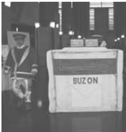
Buzón instalado en el vestíbulo del Palacio de Congresos para recibir propuestas anticrisis.

El Congreso ha organizado además la primera muestra de iniciativas y servicios de Acción social y Trabajo Social, en la que se han contemplado exposiciones, paneles informativos sobre productos y servicios de acción social, material especializado y actividades divulgativas diversas.