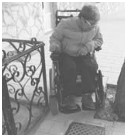
Inaccesibilidad de la acera estrecha.