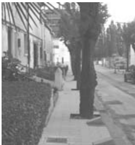
Imagen de los pivotes.