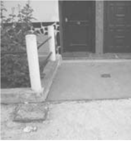
Acceso a las viviendas de la acera más ancha donde se aprecia la accesibilidad que tenían antes de la reforma.