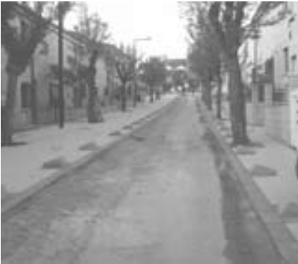
Vista general de la calle en obras.