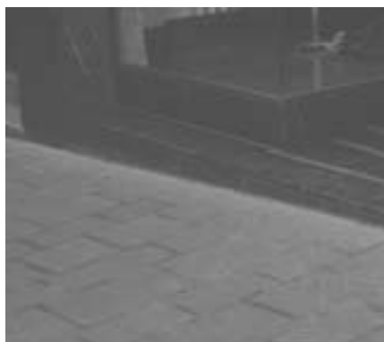
Tiendas de ADOLFO DOMÍNGUEZ el La Herrería.