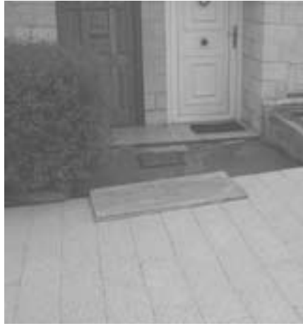
Viviendas de la acera más ancha que eran accesibles y ahora no por el desnivel creado.