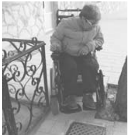
Espaloia estua denez, irigarritasun eza.