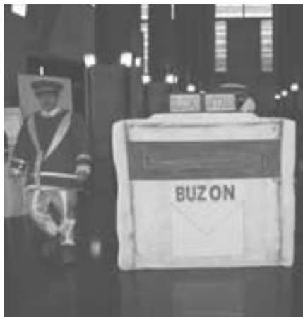
Kongresu-jauregiaren sarreran jarritako postontzia, krisiari aurre egiteko proposamenak biltzeko.

Gainera, Gizarte Ekintzaren eta Gizarte Lanaren alorreko ekimenen eta zerbitzuen erakustaldia antolatuta da aurreneko Kongresuan. Erakustaldi horretan, besteak beste, ikusi ahal izan dira erakusketak, gizarte-ekintzako produktuei eta zerbitzuei