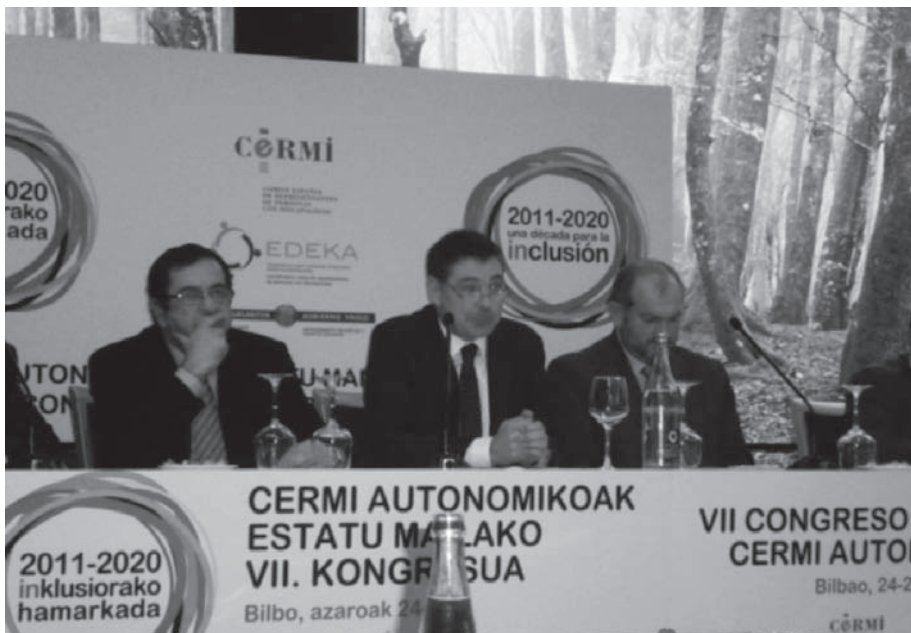
Agintariak, kongresuaren inaugurazio-ekitaldian.