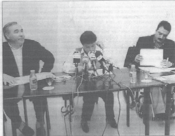
Portadores de la Coordinadora Vasca de Disminuidos Físicos.

Los portadores de las asociaciones de disminuidos físicos de Vascongadas hicieron ayer un balance de la actuación de la Administración durante la legislatura que acaba y analizaron muchos otros embargos a los lugares conquistados. Al mismo tiempo, ofertaron sus propuestas a los candidatos.