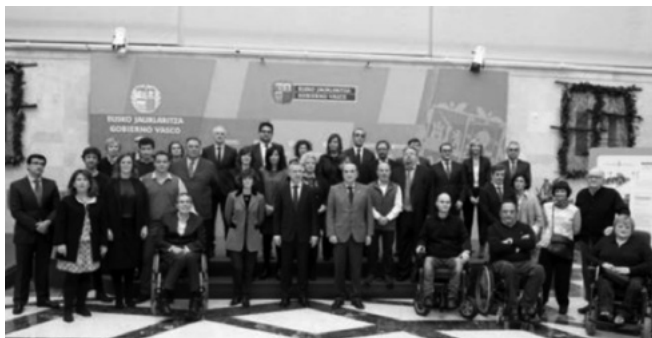
Irisgarritasuna Sustatzeko Euskal Kontseiluaren ez-ohiko bilkura. 2017ko abenduaren 4a.

Horrez gain, Irisgarritasun Unibertsalerako Euskal Estrategia lantzeko konpromisoa agertu zuen; hain zuzen ere, ELKARTEANetik